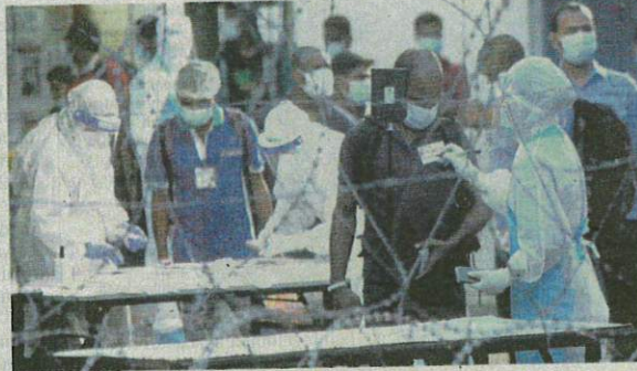
Petugas kesihatan membuat pemeriksaan ke atas pekerja Top Glove sebelum membawa keluar seramai 300 pekerja syarikat sarung tangan itu baru-baru ini.

"Kita menggunakan kit ujian pantas antigen (RTK-Ag) dalam kalangan