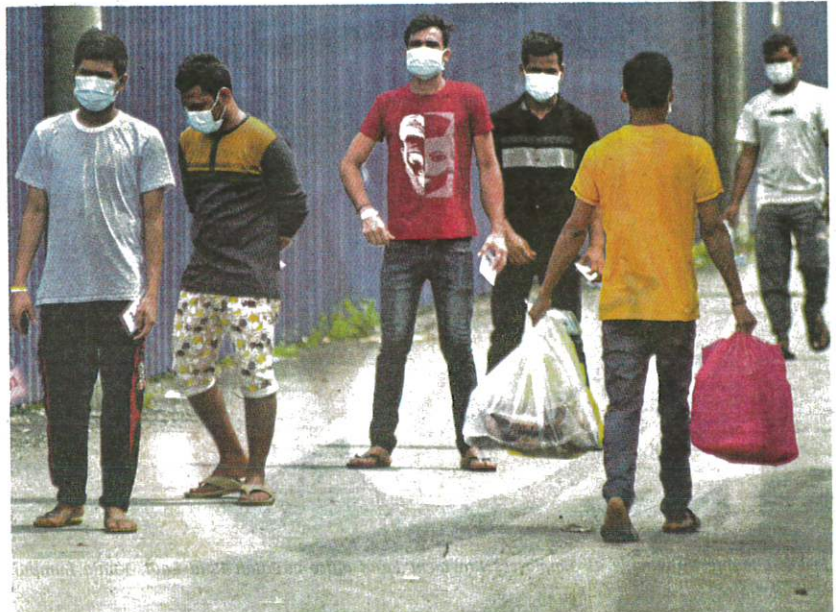
Quarantined Top Glove factory workers lining up to get food in Klang on Tuesday.

"A total of 220 people were screened and nine tested positive up to today (yesterday)."