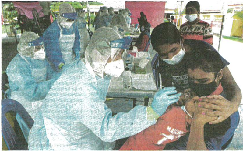
Petugas kesihatan mengambil sampel saringan COVID-19 ke atas penduduk di Dewan Orang Ramai Meru 3, Klang, semalam.

Beliau berkata, saringan peringkat komuniti menggunakan ujian RTK-Ag dimulakan dalam kalangan penduduk di Meru, Klang, bagi kluster berkenaan