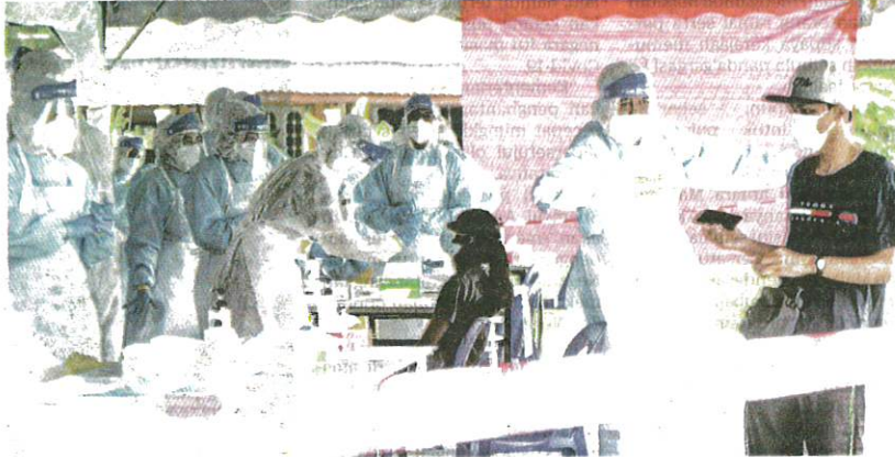
KERAJAAN Selangor menjalankan saringan bersasar secara percuma terhadap penduduk di empat lokaliti di Meru, Klang semalam.

Terdapat dua pertambahan kes kematian direkodkan di Sabah melibatkan dua lelaki berusia 63 dan 84 tahun sekali gus jumlah kematian Covid-19 terkini