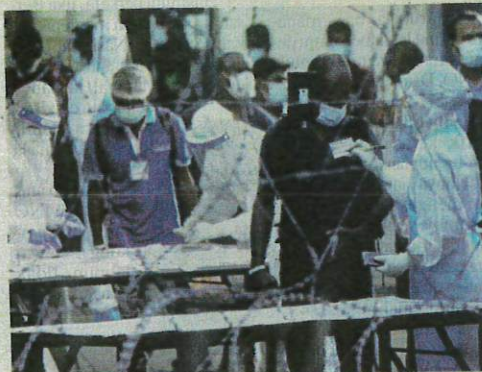
Selepas lebih sebulan PKPB rakyat mulai bimbang kerana angka kes harian Covid-19 belum menunjukkan penurunan.

"Mengharapkan PKPB sahaja tanpa penglibatan setiap pemegang taruh tersebut umpama melaksanakan pencegahan 'atas kertas'," tegas Malina.